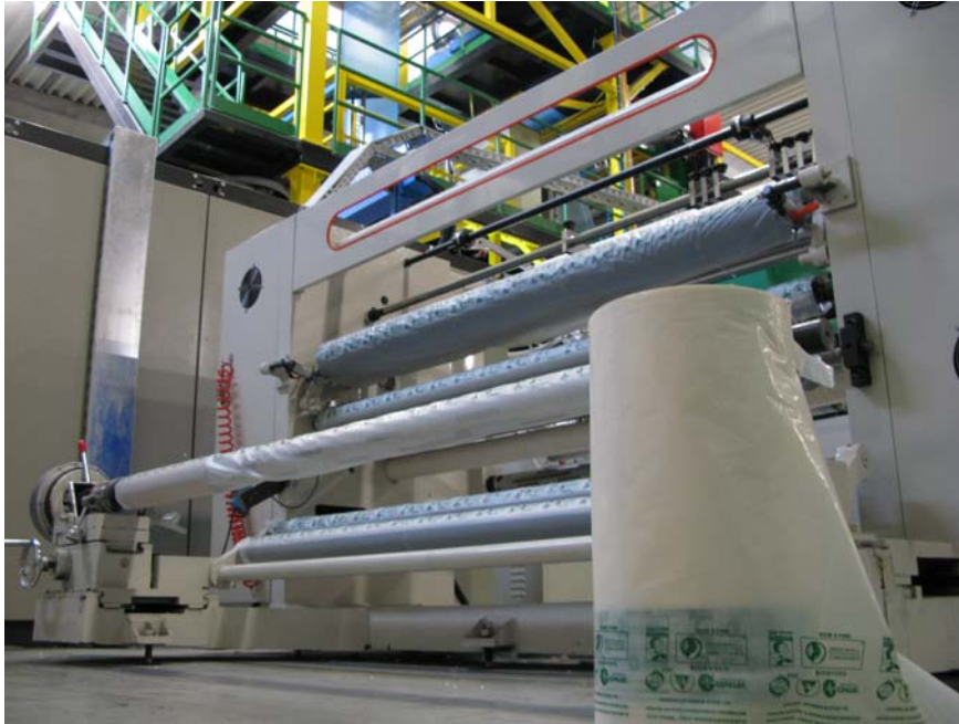
Högteknologisk utrustning förpackad i EcoCorr® för exportskeppning.

Behöver ni ett högupplöst foto? Vänligen besök: www.cortecadvertising.com