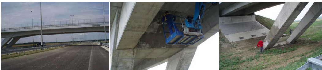
Slika 2: Nanošenje impregnacije s dodatkom migrirajućeg korozijskog inhibitora na bazi amina

U cilju dodatne zaštite armature od korozije i smanjenja atmosferskih utjecaja na svojstva betona provedena je završna obrada betonske površine zaštitno-ukrasnim premazom , slika 3.