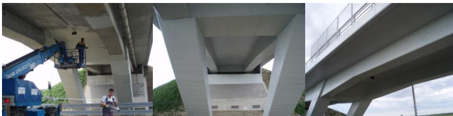
Slika 3: Nanošenje zaštitno-ukrasnog premaz na bazi 1-k akrilatnog veziva u vodenoj disperziji sa dodatkom MCI®-inhibitora