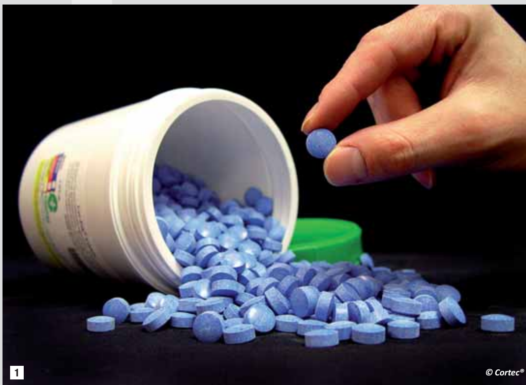
1 Get rid of rust headaches forever with Cor-Pak® tablets - a powerful corrosion inhibitor to protect metals.

Una volta evaporato, il VpCI® si attacca a tutte le superfici metalliche, raggiungendo anche le zone più nascoste. Lo strato protettivo monomolecolare non ha bisogno di essere rimosso prima di una ulteriore lavorazione. Se l'apertura del pacchetto rovina lo strato protettivo, una volta richiuso questo vapore ricostituirà una protezione continua.