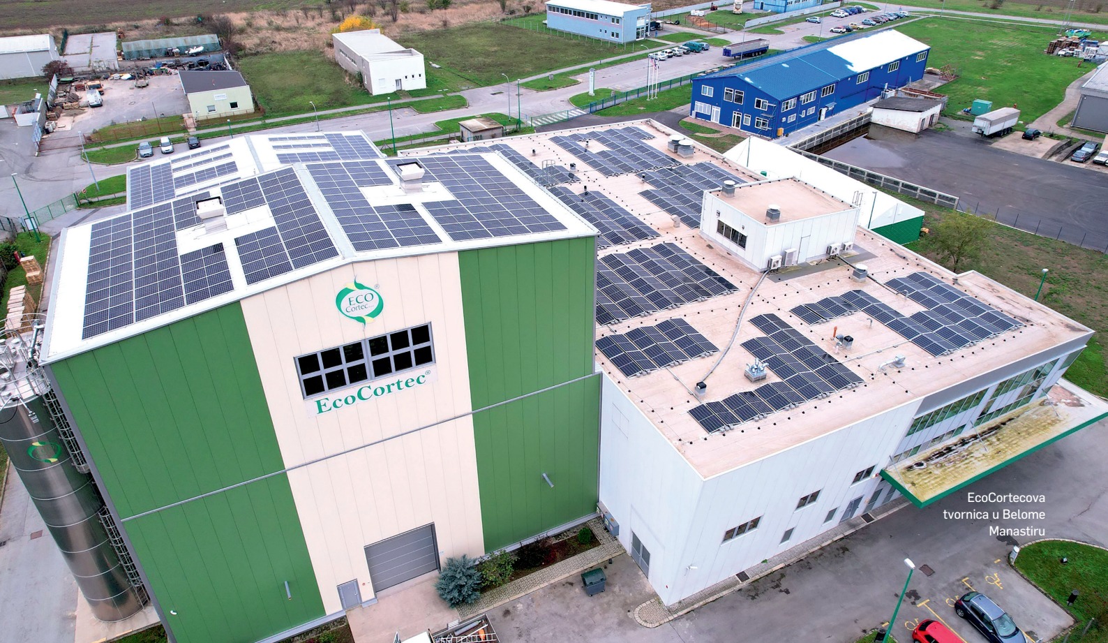
EcoCortecova tvornica u Belomorju Manastir